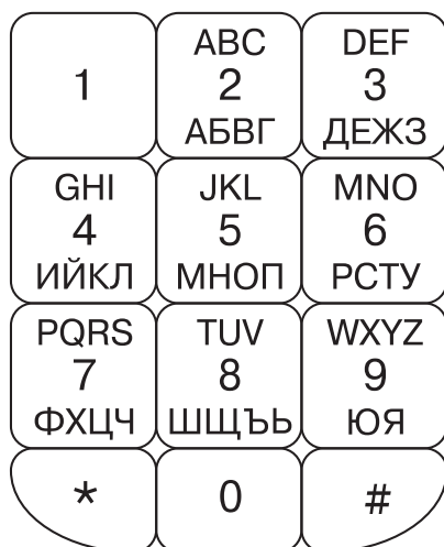
Фигура 3 Схема за подреждане – “Азбучна”

Схемите на двете системи клавиатурни подредби – “Азбучна” и “Фонетична” са показани съответно на Фигура 3 и Фигура 4 с разположение само на клавишите с номера от 2 до 9, а самите системи са описани в Таблица 3 и Таблица 4, където са посочени номера на клавиша, позицията му, изписаните букви на латиница и разположените на тяхно място букви на българската азбука, както и кодовите номера в шестнадесетично представяне на буквите от българската азбука според Unicode.