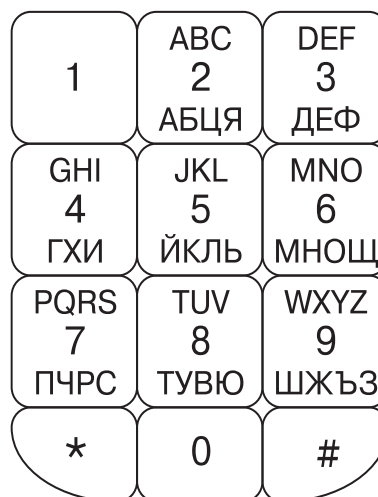
Фигура 4 Схема за подреждане – “Фонетична”